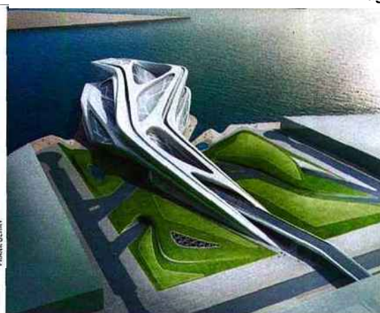
Consacré à l'art contemporain, le Guggenheim Abu Dhabi sera réalisé par l'Américain Frank Gehry. A dr., le centre de spectacles, composé de cinq théâtres et d'un Opéra. Sa construction a été confiée à la Britannique d'origine irakienne Zaha Hadid.