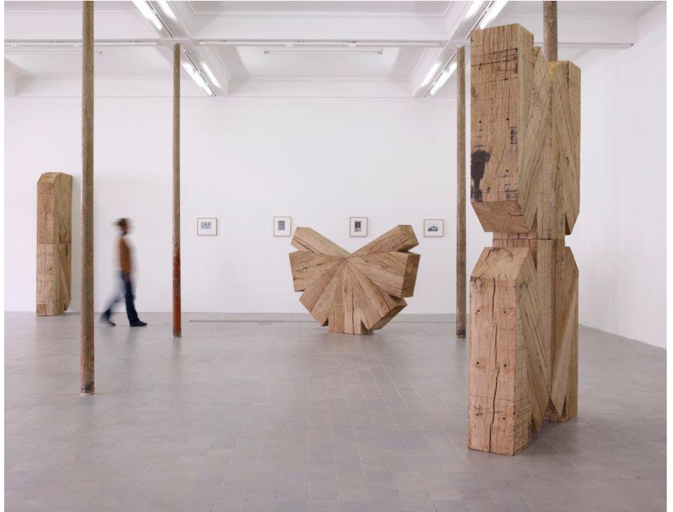
Vue de l'exposition de Raphaël Zarka à Saint-Nazaire.

figurer le cenotaphe du grand mathématicien antique. Inspirée par des cheminées Renaissance, elle se compose de deux colonnes virevoltant dans la brique ouvragée. Deux octogones emportés dans une torsade, qui créent un affolant effet cinétique et rappellent la vis sans fin qu'Archimède aurait inventée. Entre l'autel baroque, la cheminée d'usine et la colonne vertébrale déjantée, une pièce virtuose. Enfin, à l'étage, retour vers la peinture : Raphaël Zarka a choisi quelques toiles emblématiques de la Renaissance, dans lesquelles il avait repéré un mobilier particulier. Puis il s'est efforcé de reconstituer en trois dimensions ces meubles, qui prennent soudain une allure éminemment contemporaine. Posées sur des socles couverts d'une plaque de marbre, ces structures construites dans du contre-plaqué bakélinisé semblent sans âge. Très architecturées, elles pourraient tout aussi bien faire show-room d'un designer du XX e siècle. Mais l'une d'elles est inspirée du cabinet de travail du Saint-Jérôme peint par Antonello de Messine, une autre de l' Annonciation de Ghirlandaio, d'autres encore de Paolo Uccello ou Filippino Lippi. En brouillant ainsi les temps, Zarka se fait avec brio l'archéologue de notre regard moderne. ■