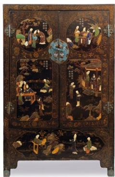
Cabinet, décor en pierres dures et ivoire, laque noire, bronze et émaux cloisonnés, Chine, période Daoguang vers 1850, 141 x 88 x 41 cm. Estimé 100 000-150 000 euros. Europ Auction, Drouot, le 14 décembre.