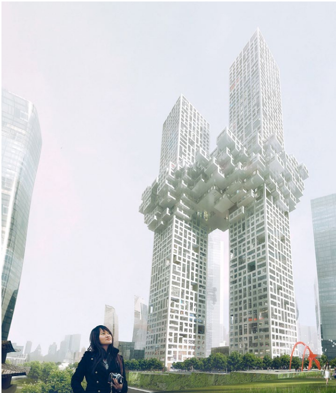
MVRDV, projet «The Cloud», Séoul, Corée du sud.

Séoul a annoncé hier qu'il maintenait son projet de construction de tours jumelles de 54 et 60 étages dans la capitale sud-coréenne. Des proches des victimes du 11 septembre 2001 protestent contre le projet «The Cloud» (le nuage) du cabinet d'architectes néerlandais MVRDV pour sa trop grande ressemblance avec les tours du World Trade Center. Les travaux devraient commencer dès janvier 2013 dans le quartier d'affaires de Yongsan, dans la capitale sud-coréenne. « Les allégations selon lesquelles (leur structure) s'inspire des attentats du 11 Septembre sont sans fondement », a déclaré White Paik, porte-parole de la société Yongsan Development Corp à l'AFP.