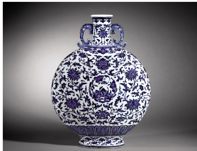
Gourde en porcelaine bleu blanc, Chine, Dynastie Qing, époque Qianlong (1736-1795), 49,5 cm. Estimé 500 000-700 000 euros. Sotheby's, Paris, le 15 décembre

famille rose, époque Qianlong (est. 350 000-400 000 euros). Parmi les lots les plus singuliers, figurent plusieurs coupes libatoires en corne de rhinocéros sculptée de la dynastie Ming, du XVI e siècle. Jeudi 15 (10 h 30 et 14 h 30), Sotheby's présente 342 lots, pour lesquels la provenance fait toute la différence. Représenté en couverture du catalogue, le vase chinois « poudre de thé » rehaussé d'or Hu, d'époque Qianlong (est. 800 000 à 1,2 million d'euros), relève d'une demande directe de