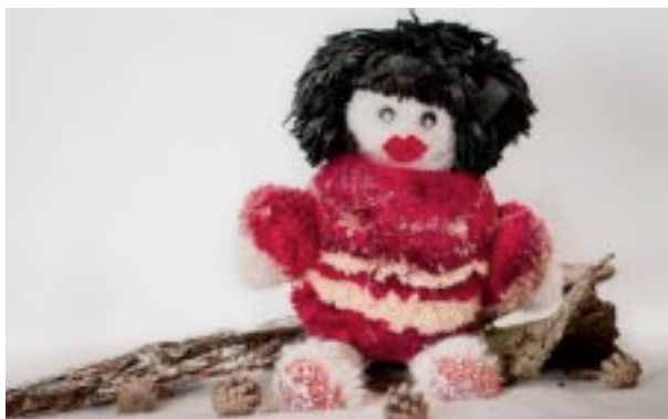
L'une des frimousses de créateurs en vente ce soir, imaginée par Sonia Rykiel