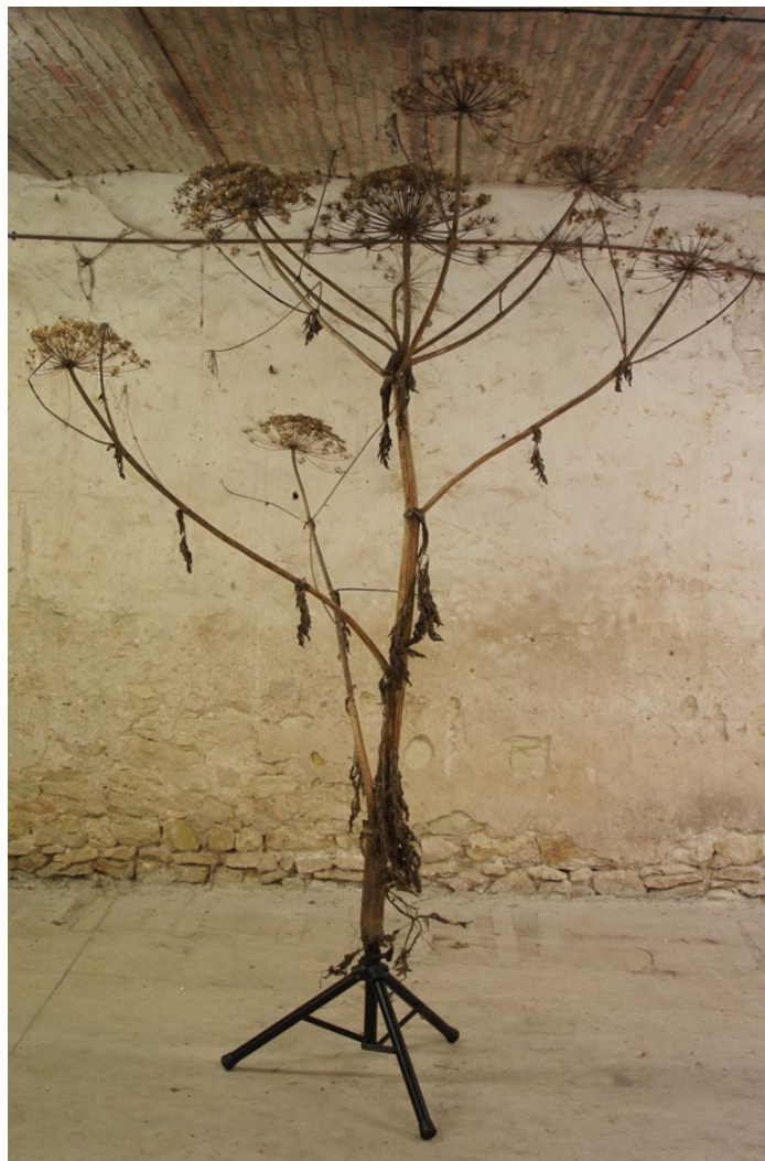
Bertrand Lamarche, Le terrain ombelliférique , 2011.

1960 par Bernard Zehruss, le Haut du Lièvre, avec sa barre mythique longue de 400 mètres baptisée le Cèdre bleu. « C'est un objet plastique éblouissant et monstrueux, quasi du land art, mais aussi un truc terrible qui a heureusement été réhabilité récemment par Alexandre Chemetoff ». Réalisée en grilles de plafond blanches, cette maquette est illuminée de l'intérieur, afin de mimer « cette rythmique musicale qui se crée la nuit quand les gens allument, pixellisant l'immeuble : quand le soir tombe, l'humanité réapparaît ; c'est ça qui est beau dans la modernité. Comme cette barre n'a jamais réussi à s'ancrer dans le sol, je la figure comme un vaisseau : après son échec, elle se taille dans le cosmos ». ■