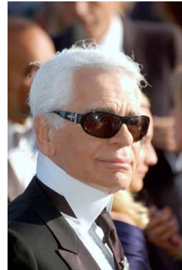
Karl Lagerfeld.

Le syndicat national des antiquaires (SNA) a annoncé hier que Karl Lagerfeld sera chargé de la mise en scène, des décors et des visuels de la XXVI e Biennale des Antiquaires. La manifestation qui réunira cette année près de 150 exposants, se tiendra sous la nef du Grand Palais à Paris, du 14 au 23 septembre 2012.