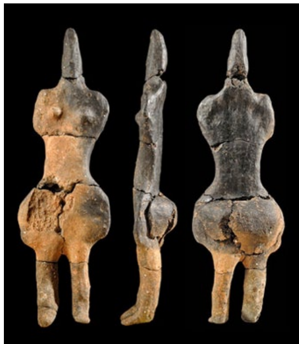
Statuette féminine, terre cuite, néolithique moyen, découverte sur le site de Villers-Carbonnel (Somme), h. 21 cm.

L'Institut national de recherches archéologiques préventives (Inrap) a annoncé hier que ses équipes avaient découvert une statuette néolithique sur le tracé du canal Seine-Nord Europe. Sur prescription de l'État, les fouilles du site chasséen (environ 4300-3600 avant notre ère) de Villers-Carbonnel ont mis au jour une figurine féminine en terre cuite, d'une hauteur de 21 cm. Cette découverte est exceptionnelle du fait de la rareté de ce type de figure du néolithique moyen, d'autant plus que celle-ci est complète. Le canal, réalisé sous la maîtrise d'ouvrage des Voies navigables de France, reliera Compiègne (Oise) à Aubencheul-au-Bac (Nord). Les fouilles préventives, qui ont débuté en mars 2010, ont permis de révéler 77 sites. Elles prendront fin normalement fin 2013.